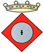
Ajuntament de Peramola